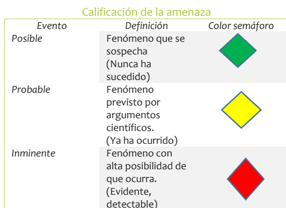
Tabla 1 Calificación de la amenaza (FOPAE, 2014)

Siendo el punto de partida, la caracterización de las actividades desarrolladas por la empresa que generan riesgo, pues esto permite su identificación y la calificación. Ahora bien, el análisis se puede gestar desde diferentes metodologías, dentro de las que se encuentra la metodología de colores, cuyo objetivo es analizar las amenazas y la vulnerabilidad que se genera desde las dimensiones de las personas, los recurso y los procesos (FOPAE, 2014).