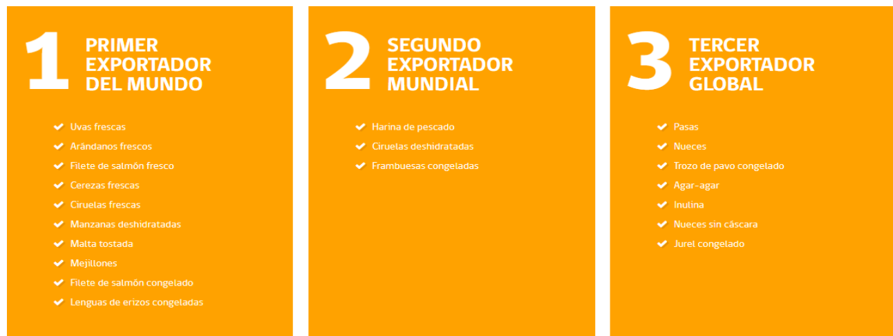
Ilustración 1 cifras de TradeMap - Centro de Comercio Internacional 2016.

Entre los principales sectores productivos de Chile se encuentran el de alimentos, industrias y servicios. Específicamente en alimentos Chile exportó USD 15.751 millones donde los países con mayor participación en la exportación fueron Estados Unidos con USD 3.958 millones, Japón con USD 1.610 millones y China con USD 1.273 millones. A continuación, se muestran algunos de los resultados que ha obtenido Chile en las exportaciones de alimentos: