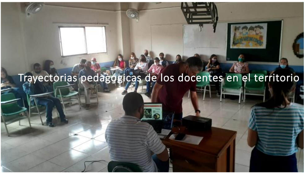
Trayectorias pedagógicas de los docentes en el territorio