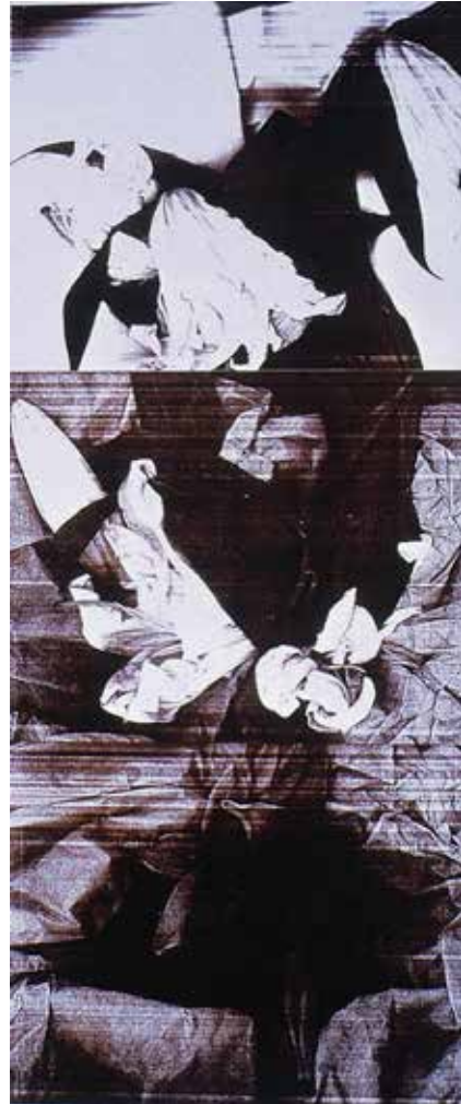
Flor de lumbre (1999)

Colección Revista Credencial, Bogotá, Colombia Florida International University, Miami, Florida Icon Building, Philippe Starck, Miami, Florida Bank Gibraltar, Coral Gables, Florida Fundación San Lorenzo de Barichara, Colombia Fundación Corazón Verde, Colombia Embajada de Colombia, Madrid, España Consulado General de Colombia, Nueva York