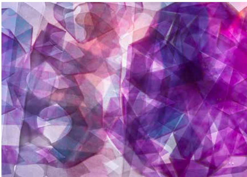
Identidad reflejada (2013)