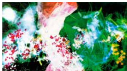
Lluvia de estrellas (2004)

Museo de Arte Moderno, Cartagena, Colombia Casa de la Aduana, Barranquilla, Colombia OBRA RECIENTE 2007 Arteconsultores, Bogotá, Colombia PARAÍSO -INSTALACIÓN 2006 Galería El Nogal, Bogotá, Colombia LUMINISCENCIAS 2005 Artecámara, Cámara de Comercio de Bogotá, Colombia SILENCIO 2004 Arteconsultores, Bogotá, Colombia DESIRE 2004 Florida International University, North Miami, Florida AGUA 2004 Centro Cultural del Brasil, Bogotá, Colombia NORTHERN LIGHT 2003 Kracar Art Gallery, Miami, Florida NATURA 2002 Arteconsultores, Bogotá, Colombia EL AMOR ETERNO 2000 Centro Venezolano de Cultura, Bogotá, Colombia