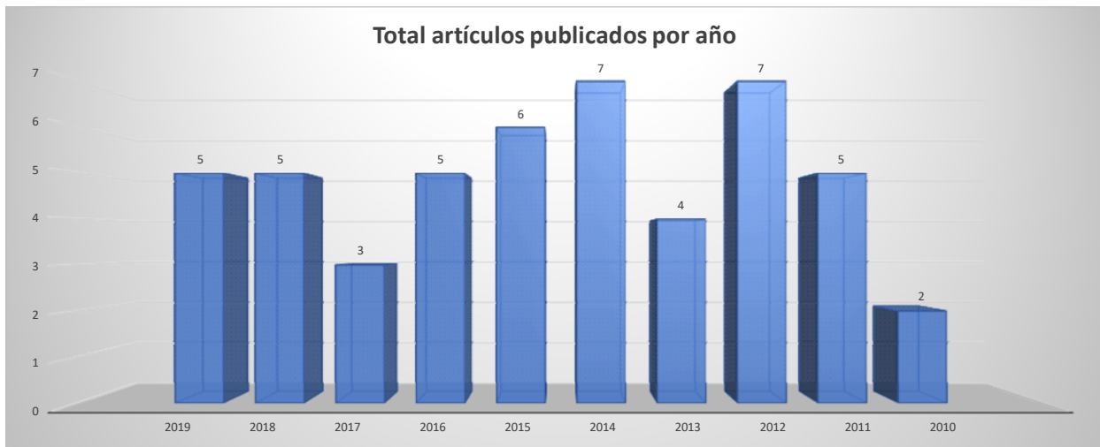
Gráfica 1: Total artículos publicados por año.

El segundo análisis que se desarrolló fue el de los países que más publicaciones habían realizado sobre educación virtual y emprendimiento. En este análisis se encontró que Colombia fue el país que realizó el mayor número de publicaciones en el periodo de tiempo comprendido entre 2010-2019, con un total de 23 artículos relacionados con la educación virtual y el emprendimiento. Luego le sigue España con 9 publicaciones de artículos en el mismo periodo de tiempo. Los demás países tuvieron entre 1 y 3 publicaciones durante el periodo de tiempo analizado. Esto se puede evidenciar en la gráfica 2.