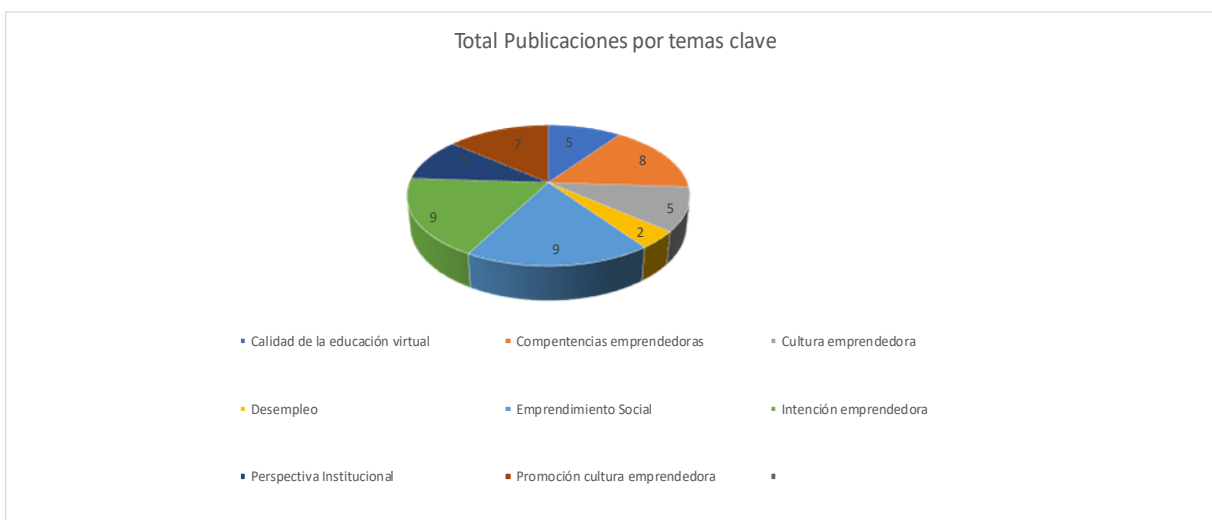
Gráfica 4: Total publicaciones por criterios.

Finalmente, con el análisis de los criterios o categorías asociadas con emprendimiento y educación virtual se pudo visualizar que los artículos que más se publicaron fueron acerca de intención emprendedora y emprendimiento social con 9 artículos en total, seguido de competencias emprendedoras con 8 artículos; mientras que el criterio de promoción de cultura emprendedora tuvo 7 artículos escritos y los criterios asociados con perspectiva institucional, cultura de emprendimiento y calidad de la educación virtual tuvieron 5 publicaciones cada uno. Por su parte, el criterio de desempleo solo contó con 2 publicaciones en el periodo de tiempo investigado. Esto se puede evidenciar en la gráfica 4.