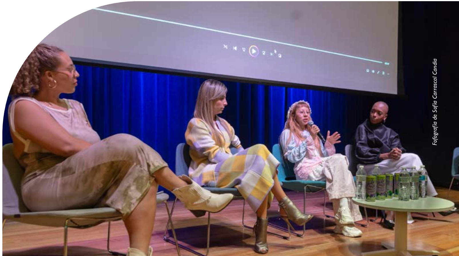
Evento Moda En Los Entornos Digitales: del periodismo a las redes