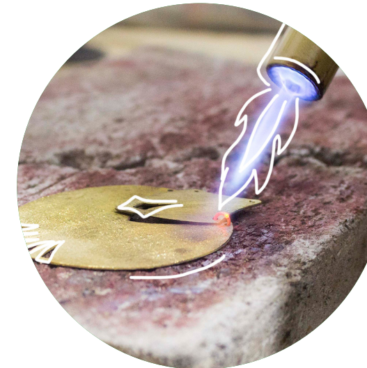
Taller-soldadura de joyería

Sus comienzos se remontan a la elaboración en pequeña escala de bisutería y dijes con piedras comerciales, lo que dio fruto un año después, empezando así a producir diseños propios los cuales las llevaron a la creación y formación de su propio taller de joyería en casa.