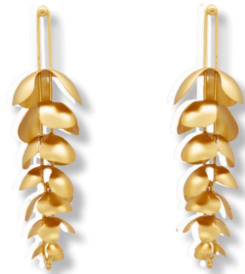
Nueva colección-Ar Orbaz

permite aplicar diferentes técnicas, como el fotograbado, en el cual se representan sus diseños, pues la unión del material base y dicho método, logra plasmar dibujos, tramas y texturas en las piezas; esto a su vez genera una mayor vida útil. Lo que los diferencia como VATTEA es la técnica que se emplea en el proceso con hilos, siendo este resultado de un largo trabajo de investigación. Junto a ello, cuentan con la personalización de colores a gusto y necesidad de los clientes, atención rápida, garantías y su pilar más significativo, el impacto social que genera al ser una comunidad de mujeres madres cabeza de familia, personas con discapacidad leve y empresarias.