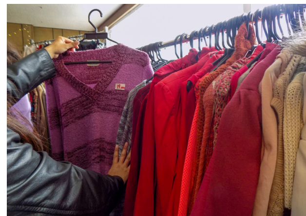
Boutique de ropa de segunda mano