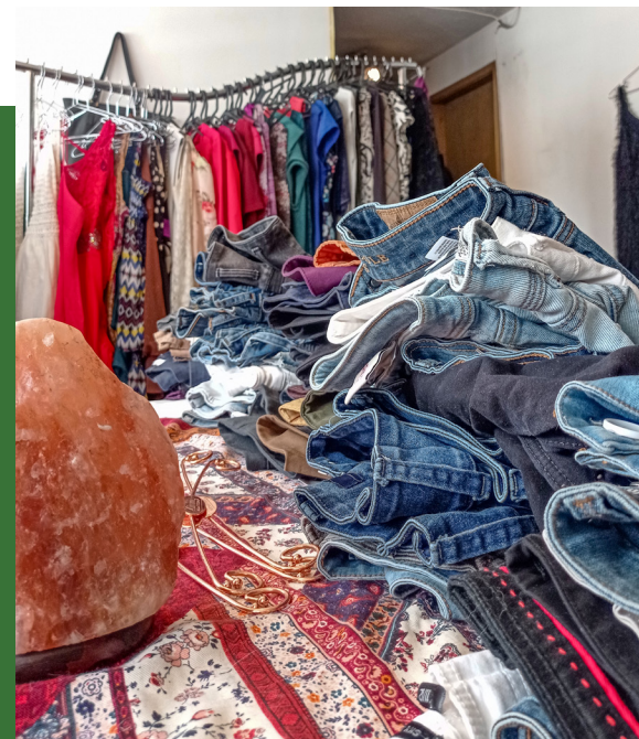
Reutilización de prendas