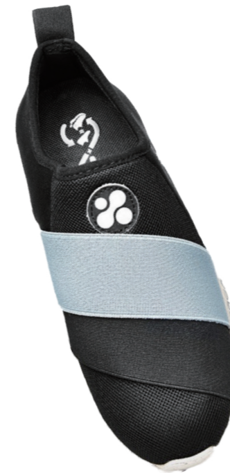
Magma Elastic. El equilibrio perfecto entre comodidad y diseño.

Con esta propuesta permite dar a conocer y aprovechar los usos generados por un residuo poco conocido, pero bastante consumido a nivel mundial, ya que partir de una botella de cerveza se pueden obtener cuatro pares de zapatos; además, cuando el cliente considere el fin de su vida útil, podrá regresarlos a la tienda recibiendo un bono de consumo por la cervecería aliada. Entonces, este proceso de renovación de un par de zapatos que cumplen su ciclo permite un 78% de aprovechamiento de la suela, generando un menor impacto ambiental de la que generalmente generaría el desecho del producto completo y aclara que el promedio de vida útil de sus productos se encuentra entre 12 a 24 meses.