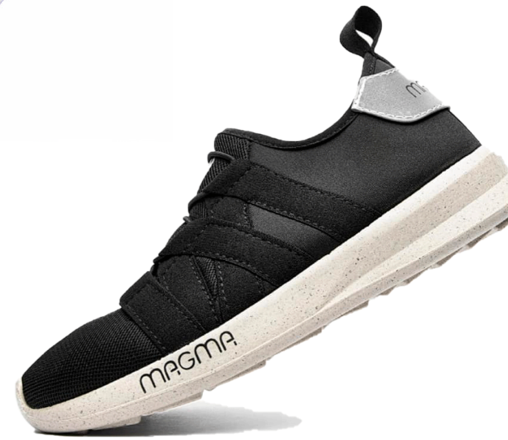
Modelo de Zapato Magma.

Con esta propuesta permite dar a conocer y aprovechar los usos generados por un residuo poco conocido, pero bastante consumido a nivel mundial, ya que partir de una botella de cerveza se pueden obtener cuatro pares de zapatos; además, cuando el cliente considere el fin de su vida útil, podrá regresarlos a la tienda recibiendo un bono de consumo por la cervecería aliada. Entonces, este proceso de renovación de un par de zapatos que cumplen su ciclo permite un 78% de aprovechamiento de la suela, generando un menor impacto ambiental de la que generalmente generaría el desecho del producto completo y aclara que el promedio de vida útil de sus productos se encuentra entre 12 a 24 meses.