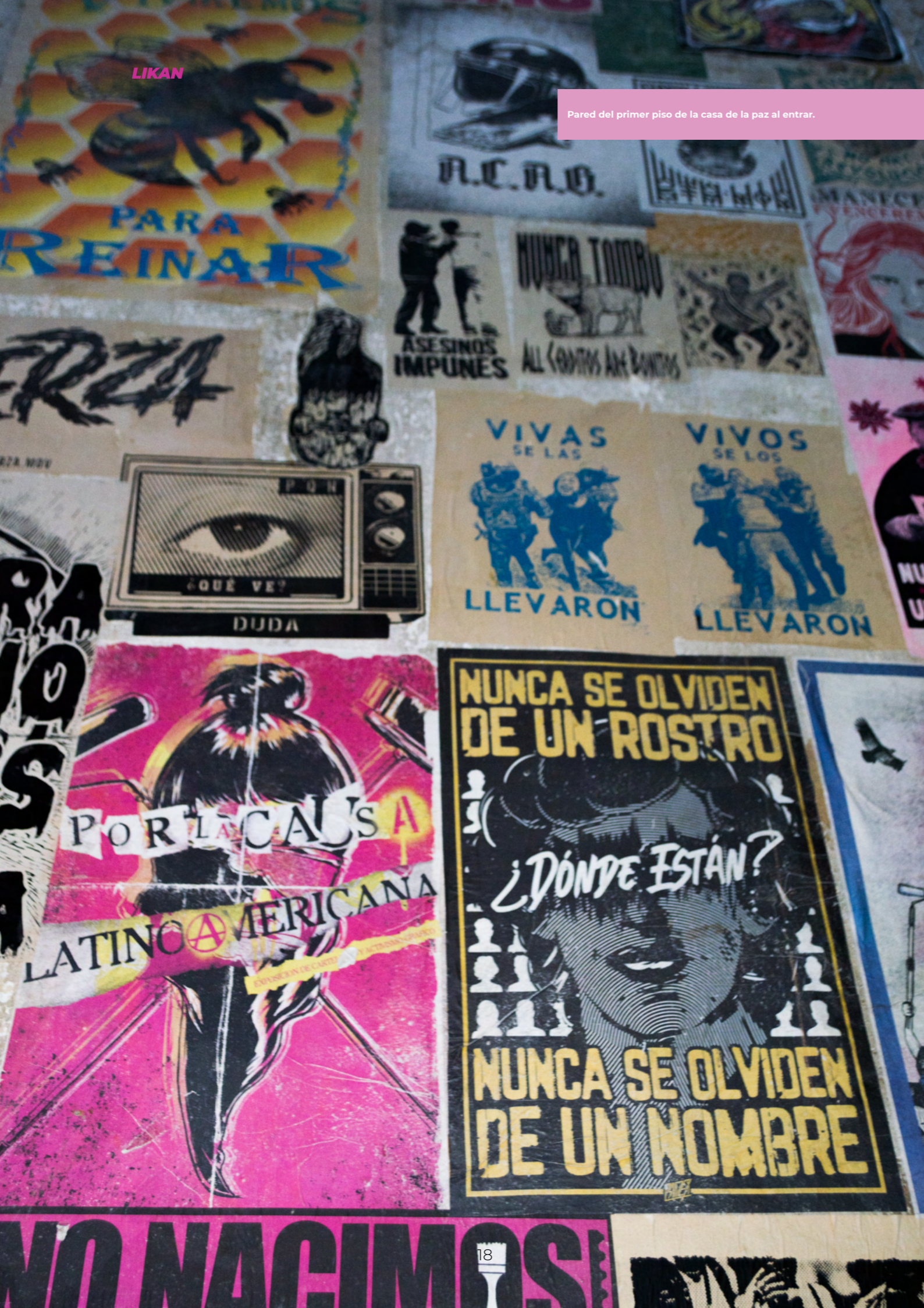
Pared del primer piso de la casa de la paz al entrar.

Comentan las creadoras que, al comienzo, fue todo un desafío construir lazos de confianza con los excombatientes, ya que ellos venían de un mundo donde solo se manejaban las armas para sobrevivir. Sin embargo, relatan que los trabajadores se dieron cuenta que Manifiesta era un espacio para generar ingresos y ser parte de la toma de decisiones de un producto. Los excombatientes y víctimas de la violencia ahora ven en Manifiesta una oportunidad para cambiar sus vidas y emprender proyectos propios.