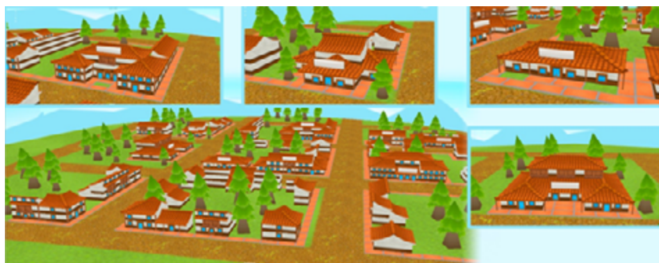
Figura 2. Vistas del pueblo de Tangamandarino, laboratorio de suelos OAT