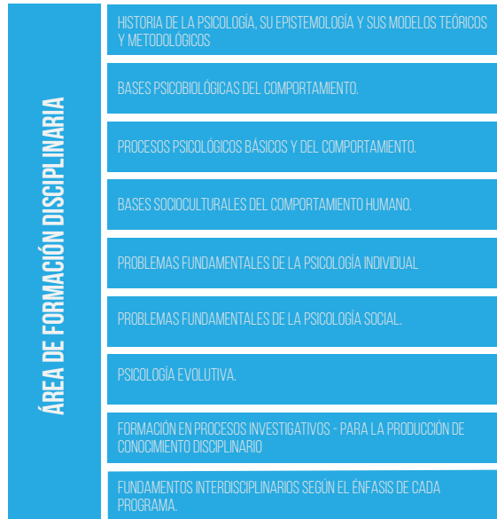
Figura 1. Núcleos disciplinares para la formación del psicólogo

| Fuente: programa de Psicología (2019) tomando como referencia la Resolución 3461 de 2003