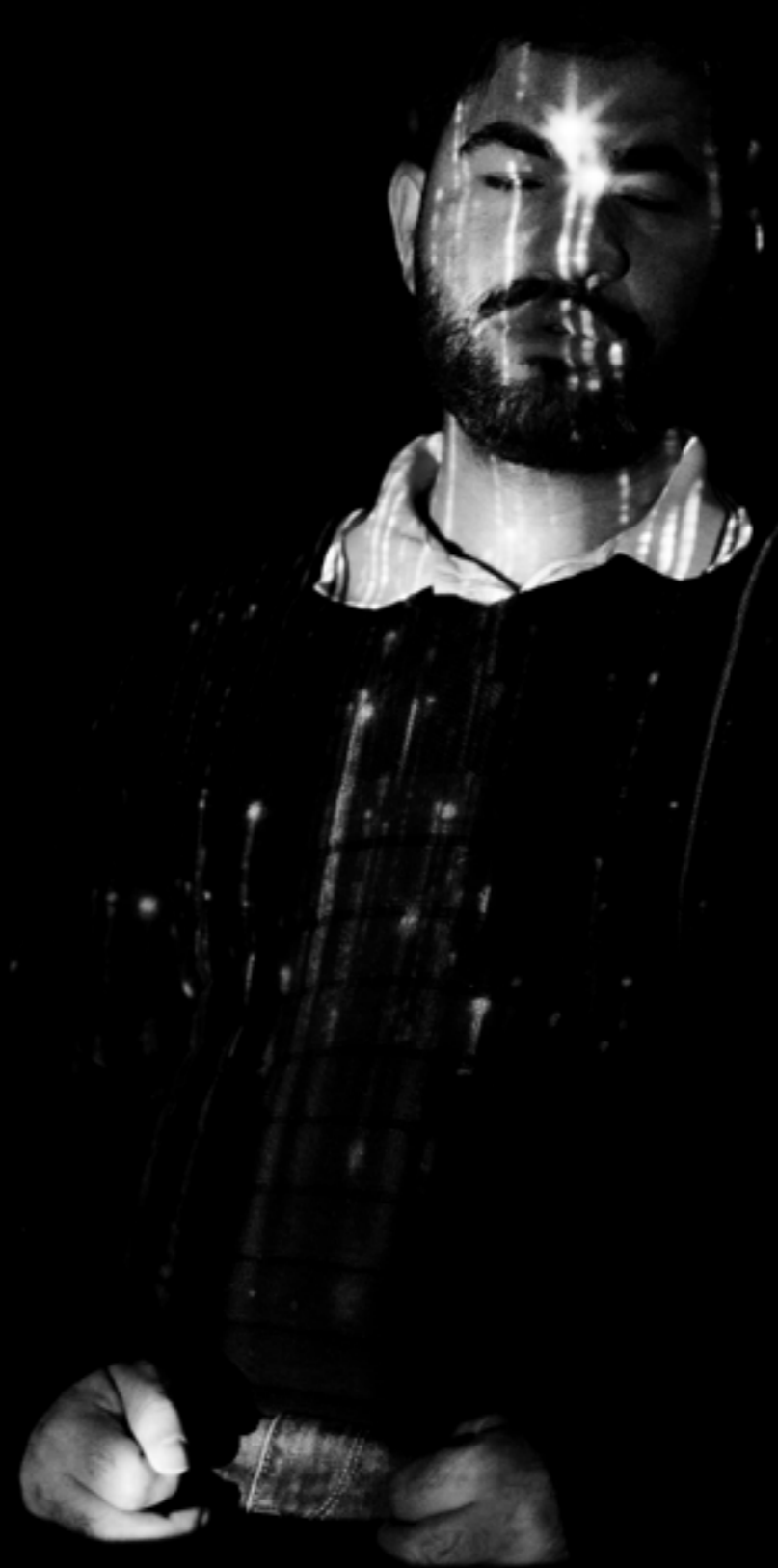
Ademillion, Fotografía de Eduardo Vieira de su serie Olhos Lúzios (2024). Brasil.