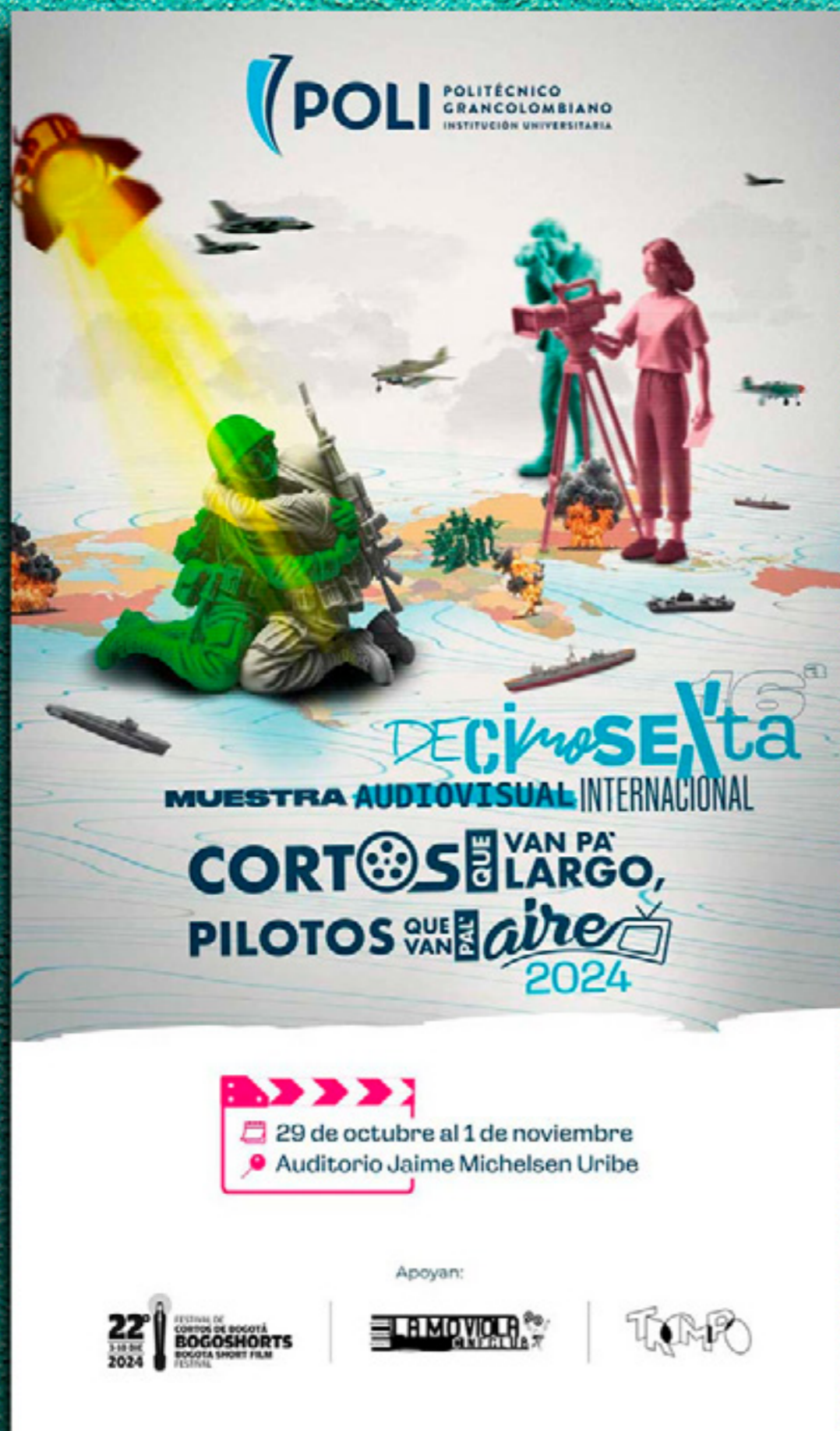
Poster oficial Muestra Audiovisual 2024