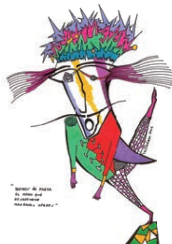
Ilustración: Andrés Romero Baltodano