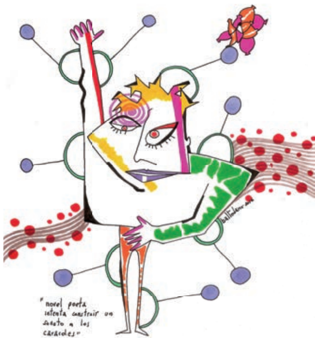
Ilustración: Andrés Romero Baltodano

Cuando a una le prestan un libro con tanto afecto, generosidad e interés por lo que pase con su lectura (la mía), pues hay que leerlo. Esto me sucedió con Sinceramente , que más allá de la apología que hace la autora de sus presidencias y de la de su marido y del inventario de obras que se hicieron durante sus gobiernos y de la queja constante al gobierno de Macri por la destrucción de todo lo que se hizo, y de las explicaciones por sus bienes adquiridos, y del análisis crítico vandijkniano a la prensa Clarín, y del relato policial “Nisman” (está buenísimo).