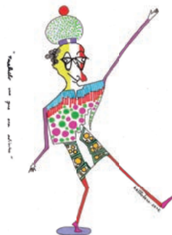
Ilustración: Andrés Romero Baltodano