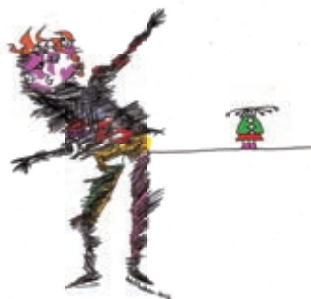
Ilustración: Andrés Romero Baltodano

para ilustración en después de noche, año 1997, en la "galería de Montevideo"