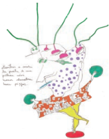
Ilustración: Andrés Romero Baltodano

Que asco de gente. Es increíble que sigan lucrando con eso. /Quién paga los gastos? /Ya de por sí la UNSAM me suena a KK /Cuando fui a buscar el libro, escuché unos minutos la charla de ese y se esforzaba para dilatar el tiempo sin decir nada concreto, como que tenía que hablar xx minutos sin importar el contenido. Tal vez estoy equivocado, pero lo que si se es que no soporto esa fauna jsjs /Abzo (sic).