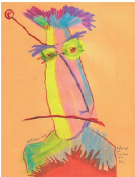
Ilustración: Andrés Romero Baltodano