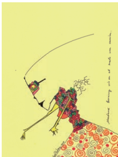
Ilustración: Andrés Romero Baltodano