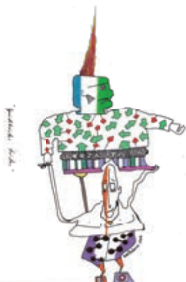
Ilustración: Andrés Romero Baltodano

Un amigo me pidió que le consiguiera El buen dolor y lo encontré, pero antes de entregárselo lo leí, y descubrí que era una especie de nouvelle autoficcional. El protagonista es un escritor G, de clase media baja, que escribe su historia familiar centrandó su atención en la cotidianidad y en las relaciones personales y sociales entre sus miembros; además, y lo que a mí más me interesó, se narra el momento en que G cuenta que tanto a los pobres como a los enfermos les cuesta expresar lo que les pasa realmente, por eso simulan, mienten, engañan, se autoengañan. También habla de la muerte que desnuda la realidad y libera al enfermo del dolor, sin embargo, es injusta con los pobres porque “una vida no alcanza para pagar una fe”.