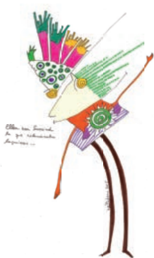
Ilustración: Andrés Romero Baltodano