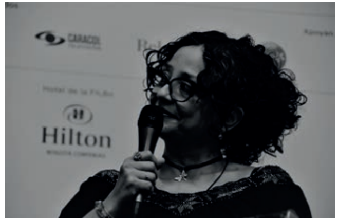
Serie Valeria Gallo

VG: depende que tipo de dibujo que sea. Creo que el estilo en ilustración tiene más que ver con un discurso estético. En ese sentido, poco importa si es realista, si se hace síntesis de la figura, si se usan formas abstractas, etc. Lo que manda es el discurso.