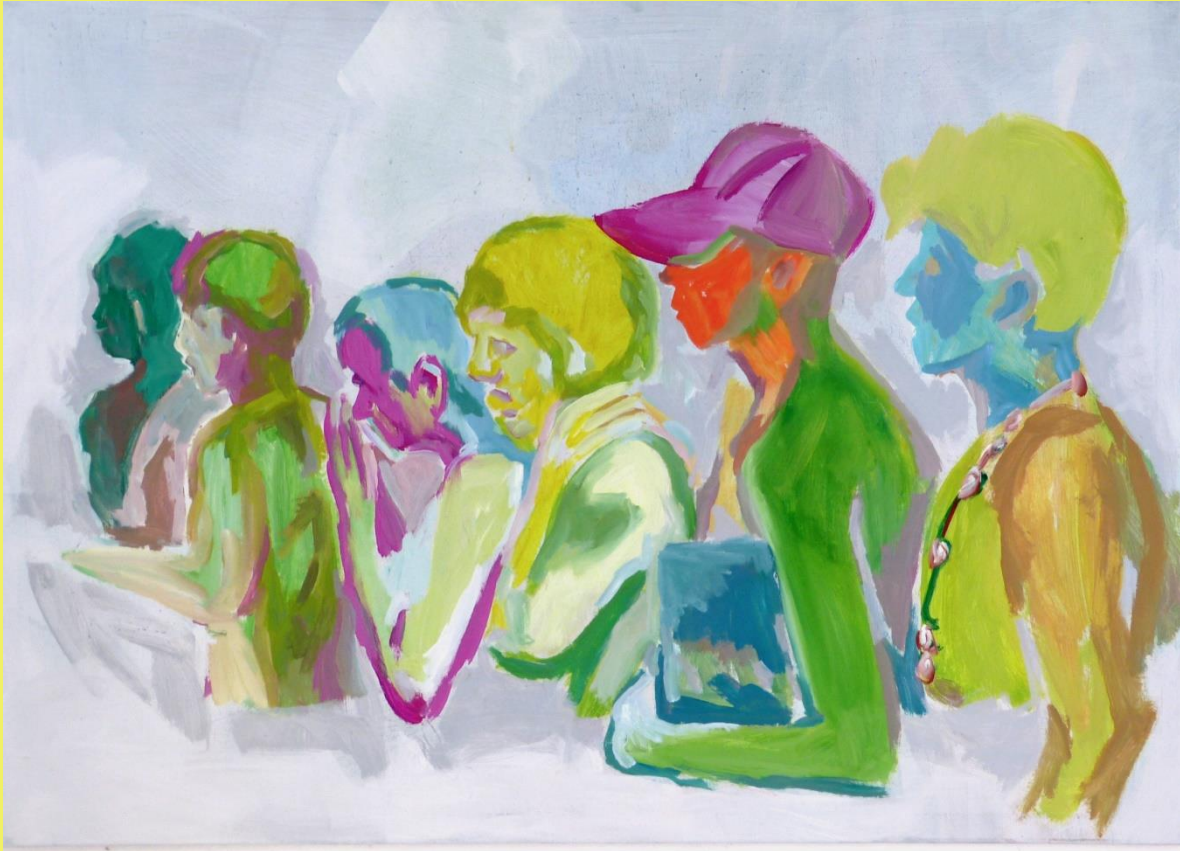
Culebra. 2017 Acrílico sobre lienzo 160 x 120 cm