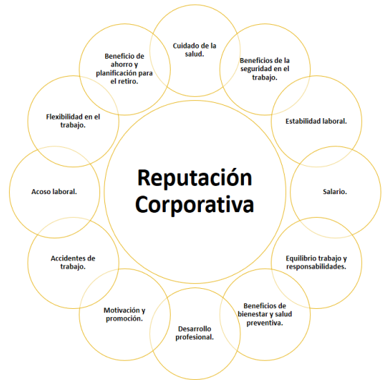
Imagen 2: Atributos Clave Evaluación Indicador Talento/Capacidad de Atención y retención del talento humano.

beneficio de la reputación de las compañías demuestran el efecto que tienen los programas de prevención y capacitación de riesgos laborales en la evaluación final reputacional.