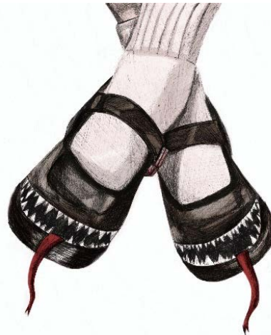
Imagen 8. Ilustración desarrollada sobre el texto Descripción de un sentimiento.