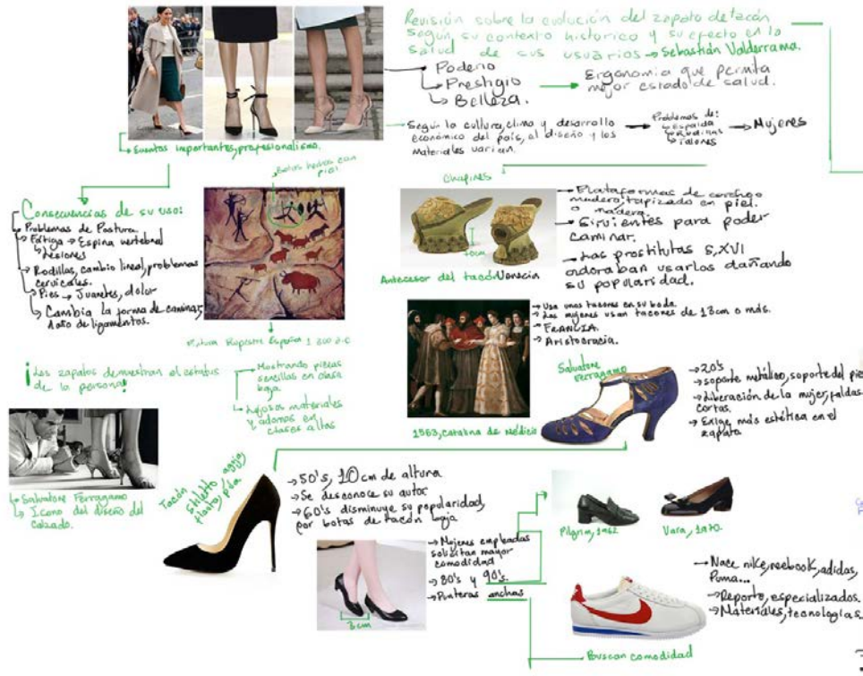
Imagen 5. Mapa mental sobre textos investigados del calzado.