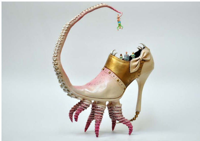
Imagen 1. Arte plástico de Costa Magarakis, referencia visual. https://cutt.ly/kgUdKSO