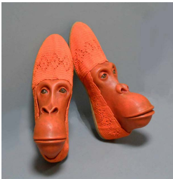
Imagen 2. Arte plástico de Gwen Murphy, referencia visual. https://cutt.ly/OgUfBrv