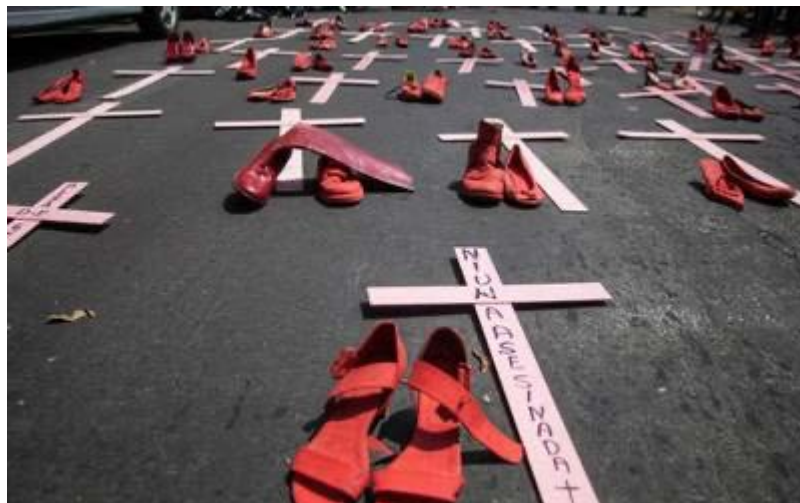
Imagen 3. Hidalgo registra 59 asesinatos violentos de mujeres en 2019. https://cutt.ly/DgUdhWc