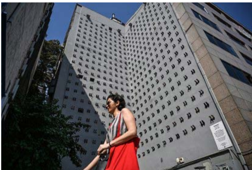
Imagen 4. 440 zapatos en un edificio mostrando las mujeres asesinadas por sus maridos. https://cutt.ly/kgUdKS0